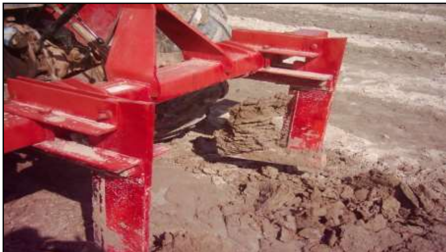
الشكل (1): محراث تحت التربة ثنائي السلاح.